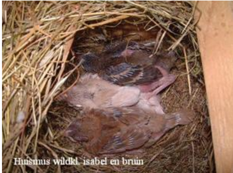
Huismus wildkl. isabel en bruin

meerdere koppels in één kooi. De vluchten zijn 3 mtr. breed, 2 mtr. hoog en 4 mtr. diep. Daarvan zijn de achterste 1½ meter overdekt met polyester golfplaten. Daaronder hangen de nestblokken. Verder zijn het open volières met zwarte grond. Mussen zijn dol op zandbaden. Dus als men gaat kweken op betonvloeren, zorg dan altijd voor een bak met zand op de grond. De kooi